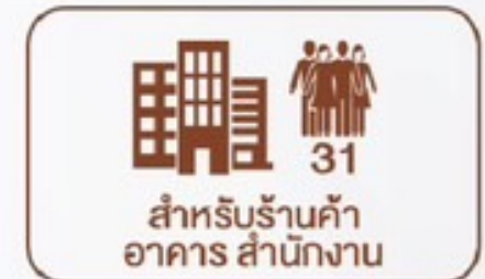
สำหรับร้านค้า อาคาร สำนักงาน