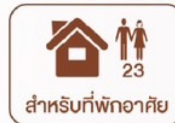
สำหรับที่พักอาศัย