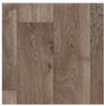
ระบบพื้นลดแรงกระแทก ยูนิกซ์ รุ่น อัลติเมต ไอคิโตรอนโต 542

ระบบพื้นลดแรงกระแทก (Shock Absorption Floor) รองรับการอยู่อาศัยร่วมกันอย่างแท้จริง ด้วยนวัตกรรมใหม่ที่สามารถช่วยลดความรุนแรงของการบาดเจ็บเนื่องจากการหกล้มกระแทกพื้น เพิ่มความปลอดภัยให้ผู้ที่มีความเสี่ยงในการล้มเป็นพิเศษ โดยเฉพาะผู้สูงอายุที่มีความเสื่อมถอยของระบบกระดูก กล้ามเนื้อ สมอ และการควบคุมการทรงตัว หรือมีปัญหา ปวดเข่า ปวดสะโพก รวมถึงยังรองรับผู้อยู่อาศัยที่เป็นเด็กได้อีกด้วย