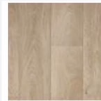
ระบบพื้นลดแรงกระแทก ยูนิกซ์ รุ่น อัลติเมต ไอคิโตรอนโต 593