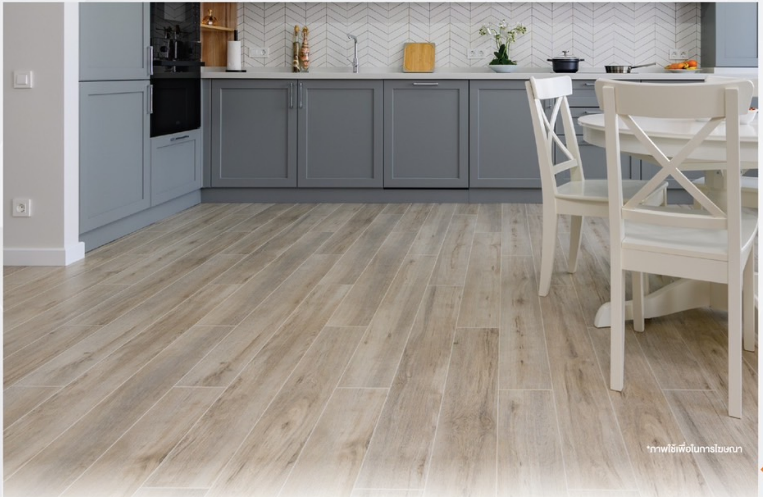
*ภาพใช้เพื่อการโฆษณา